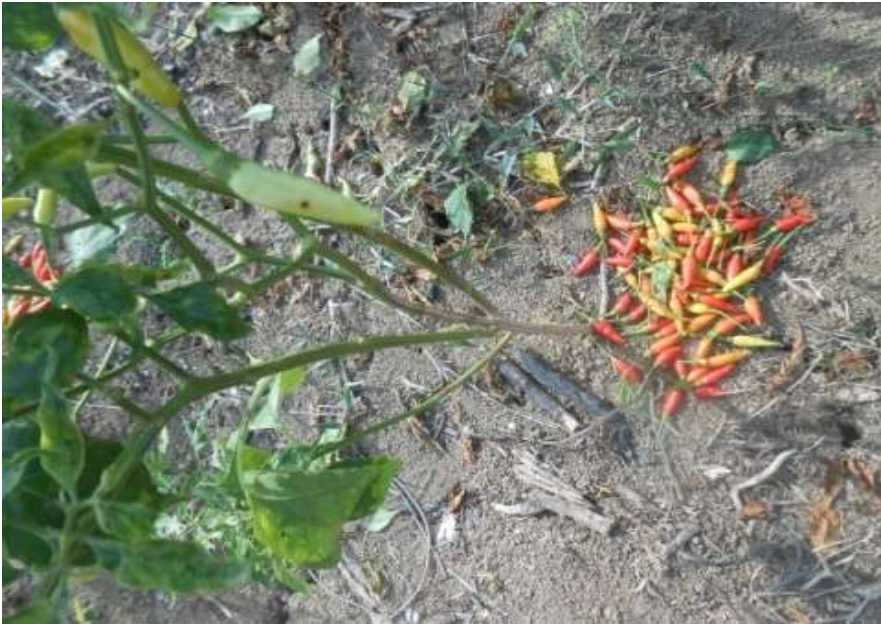
Lampiran Gambar 5. Pemanenan Buah Cabai Rawit