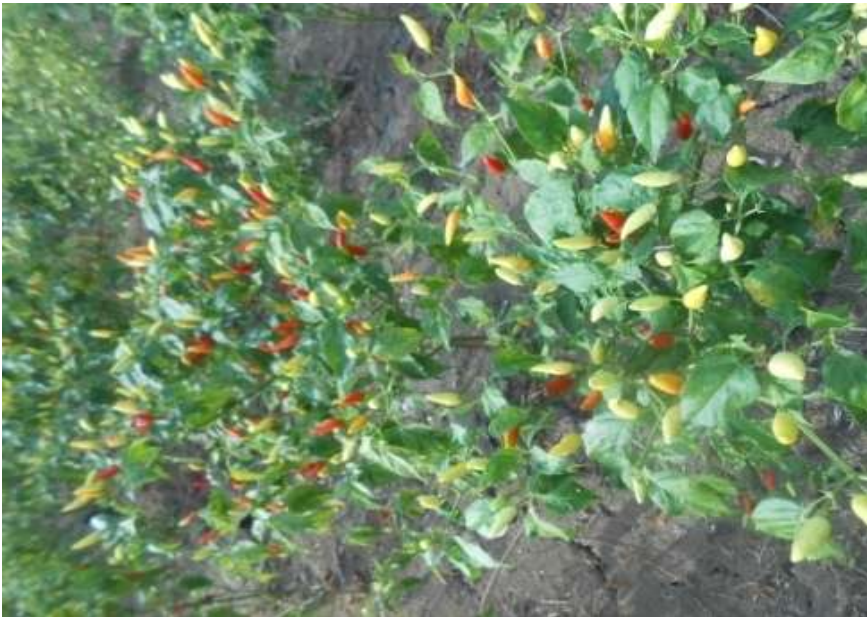
Lampiran Gambar 4. Umur Tanaman Saat Panen