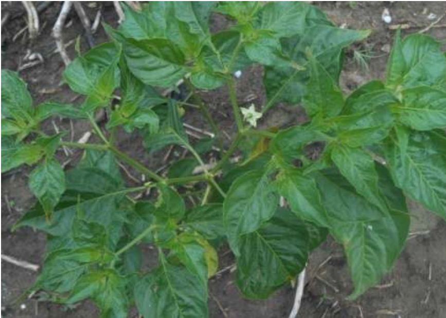
Lampiran Gambar 3. Umur Tanaman Saat Berbunga